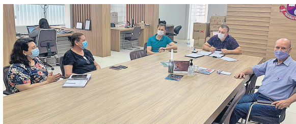
Helaine Smitz/Konrad Câmara de Frederico Westphalen

Dando sequência nas reuniões setoriais de ajustes do Código de Posturas para Frederico Westphalen, articuladas pela Câmara dos Vereadores, ocorre hoje, 24, mais uma edição dos debates que antecedem as audiências públicas. A pauta da reunião, que acontece a partir das 9 horas, será relacionada ao funcionamento dos estabelecimentos comerciais e empresariais de FW, e contará com a participação de representantes da Associação Empresarial (AEFW), da Associação de Supermercados de Frederico Westphalen (Afresuper) e da Secretaria de