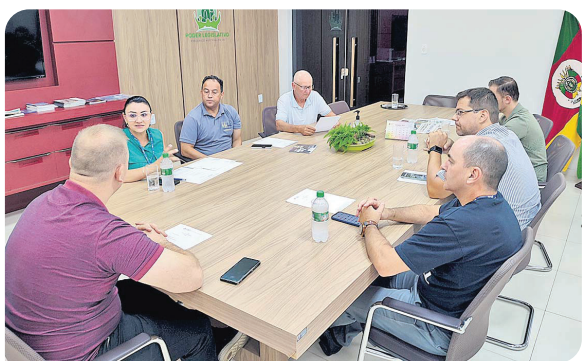
Assom: Câmara de Vereadores de Frederico Westphalen

A reunião teve como objetivo buscar uma maior aproximação entre a Mesa Diretora e a nova direção da universidade e parcerias entre a URI e o Poder Legislativo em projetos que