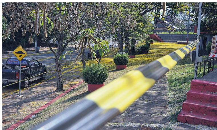
Área para convivência acaba se tornando local de vandalismo e perturbação do sossego para vizinhança, principalmente nas madrugadas

neiro salienta que é lamentável que tenha que ser feito um projeto que cerceie o direito de ir e vir e frequentar os locais públicos para que seja respeitado o direito ao sossego e ordem pública. "A maioria dos jovens de Frederico Westpha-